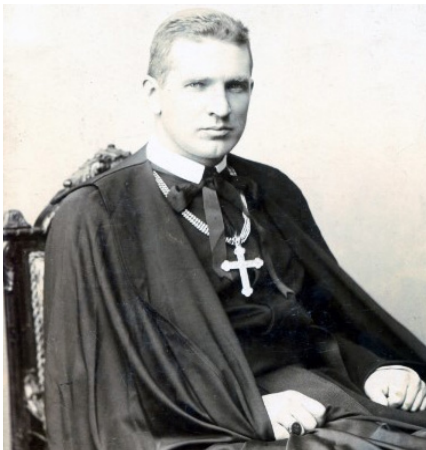
Jeune moine André Cheptytsky

Roman Maria Aleksander Szeptycki, est né le 29 juillet 1865 à Prylbytchi près de Yavoriv dans la région de Lviv. Son village natale est situé à 40 km à l'ouest de Lviv en Ukraine occidentale (Galicie) qui faisait alors partie de l'empire d'Autriche-Hongrie. Sa famille était d'une