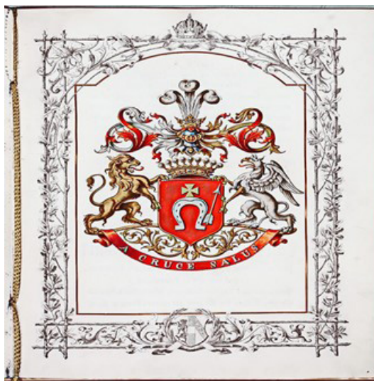
Герб графів Шептицьких (ДЕВІЗ: A CRUCE SALUS. СПАСІННЯ У ХРЕСТІ)

• “Заховуйте супокій. В Божих руках наша доля; без Божої волі і волос з голови не спаде. В Бозі наша надія і сила. В огні сеї страшної війни виконується красша для нас доля”.