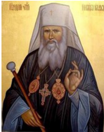
МИТРОПОЛИТ АНДРЕЙ ШЕПТИЦЬКИЙ (25 липня 1865 р. – 1 листопада 1944 р.)

Попри чернечі обітні до особистого смирення та утримання від розкошів, владика мав неабиякий підприємницький хист. Чималі особисті кошти він вкладав у розвиток різних проєктів, навчав українців фінансової грамоти, наполягав, аби, окрім богословських знань, священники опанували ще й світські ремесла. До цього спонукали обставини: адже УГКЦ не мала жодної державної підтримки ані за Австро-Угорщини, ані за Польщі. Значна частина коштів церкви йшла на створення шкіл, лікарень, санаторіїв, музеїв, на кооперативний ліцей, садівничо-городню та хліборобську школи. Митрополит був серед засновників Земельного банку гіпотечного – єдиного українського банку, цінні папери якого визнавалися у всіх банках Єв-